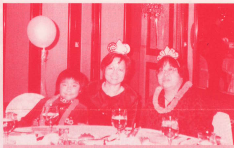
珍姐與娥姐（程福祥太太）母女合照。