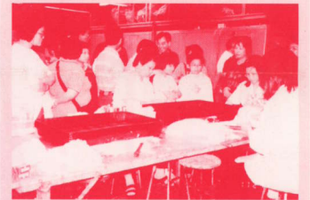
恒香餅家內睇某某整餅。

午膳品嚐盆菜餐，其間又設有圍獎。經過一頓豐富的午膳後，又再前往元朗恒香老餅家工場參觀，試食臘腸卷，臨別依依，各人也掏腰包，買一些恒香特產作為手信。