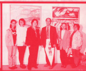
與全班合影，楊翁都著番條裙。