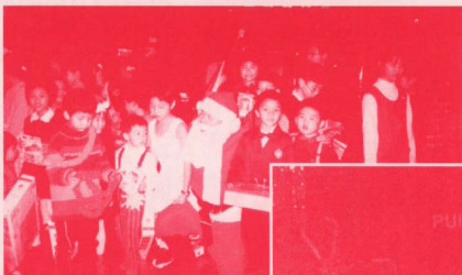
聖誕老人與出席小朋友分享禮物。