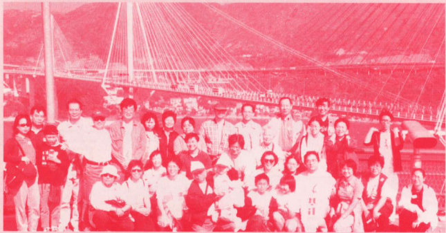
部份未走散之社友於青馬觀景台留影。