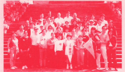
全體於雲浮仙觀大合照。