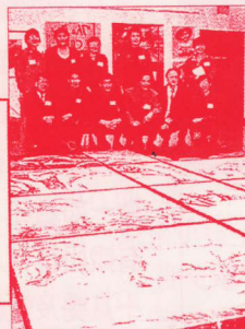
圖為十一位藝術家在《現代雲山廟中國》前合照

藝實舖校友 (71 基社) 聯同十一位藝術 家, 7 月詩大畫展之聯, 11 月中旬為 又在卑詩大學亞洲中心學聯展, 圖 他們的合照及 作。