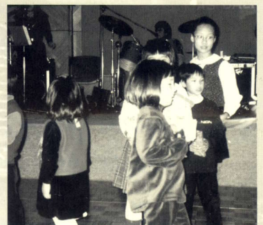
參加之小朋友最為開心。