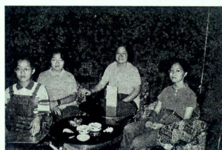
☆半邊天：老孫背後何止一位女士，今次活動所有獎品之選購及包裝皆有她們主理，老孫係度印印腳。

過程當中，程福祥副主席聽聞家人在前往沙田培英途中，遇上交通意外，而匆匆趕赴醫院，及後仍能帶同略受皮外傷之妻兒出席是晚之卡拉OK自助餐。唱所欲言，正好給與現代人一種減壓方式，眼看程翁一家大小唱得幾唱，已忘記較早前之恐懼。而