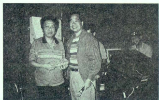
☆「抗議」！你都影得人多，你都有今日啦。