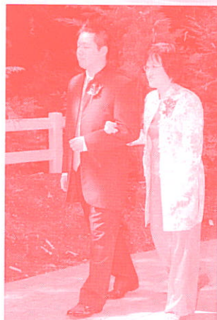
Mother & Son

翌日清晨女婿來電問候,他才知道外父日昨與自己的身痛(不是心痛)搏鬥了一整天。還好,眾人皆高興,無因個人的痛症影響整體氣氛。在送嫁的紅地毯上,短短幾分鐘,彷彿為人父母一生的縮影—子女自出生以來,都需要父母扶持,長大了出嫁時,左手痛仍要作她的扶手,以免她給婚紗絆倒出醜—父母親在得時不得時,甚或忍痛都要作為子女成長的扶手。