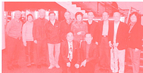
基社同學與各位老師合照