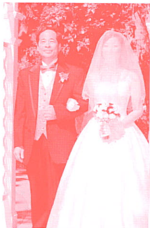
Father & Daughter

8月14日晚飛上波特蘭,翌日早上偕同子女接月兒和她妹妹(及女兒)飛機;8月19日是婚禮日,一大清早送新任外母到兄長家中會合新娘子,等候新郎及兄弟來接新娘。喧鬧一番,才分別驅車到戶外的婚禮場地綵排及拍家人照;11時過些,便是外父上場送嫁。一世人只此一次,實在難忘—難忘的不是只此一次,乃週前舊患又起,左頸、肩、臂和手疼痛不已,當日尤其晚宴之時更甚。可能已忙了一天,加上前幾天又睡眠不足;那天日間不斷招呼親朋,晚上坐在主家