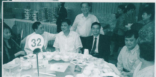
基社社友暢談近況。