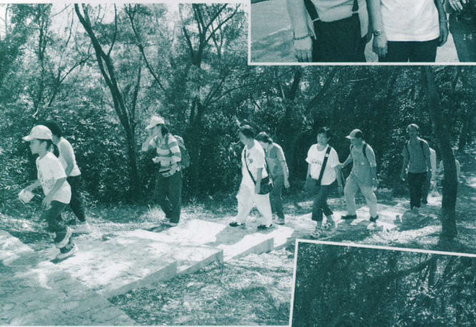
齊齊行「十二生肖家樂徑」。