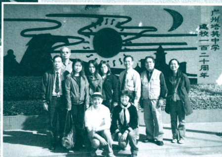
在廣州培英壁畫前合照。