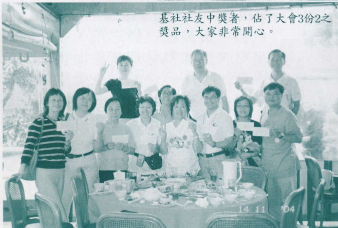
基社校友中獎者，佔了大會3份2之獎品，大家非常開心。