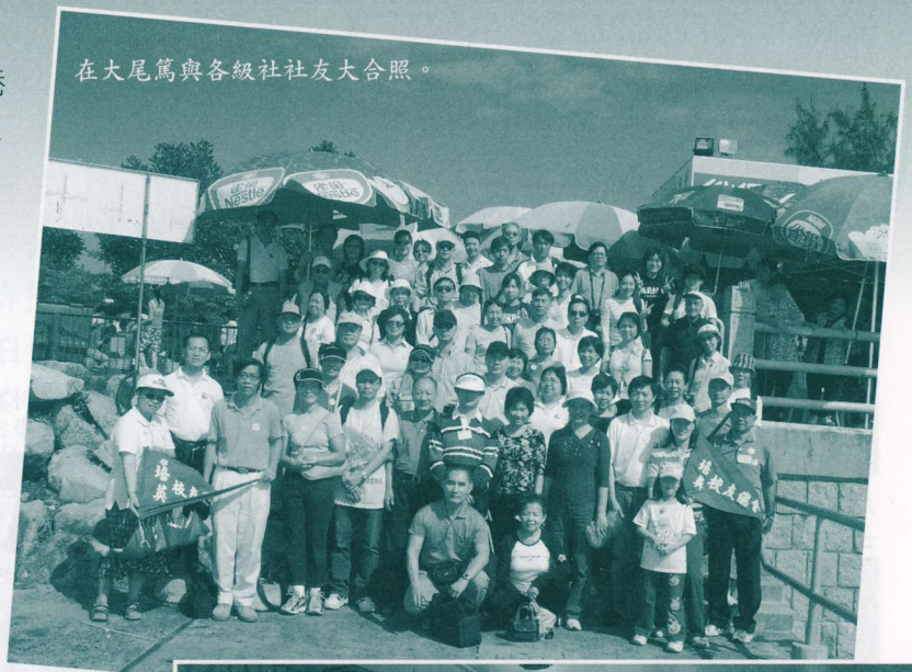
在大尾篤與各級社校友大合照。