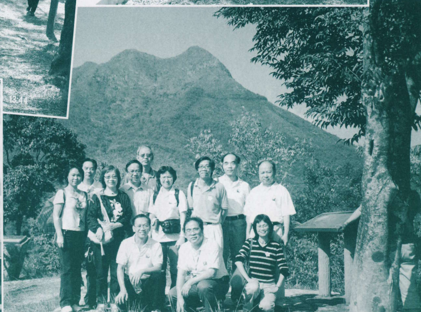
基社校友在「八仙嶺」前合照。