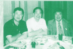
▲ 首度露面陳德華(右一)。