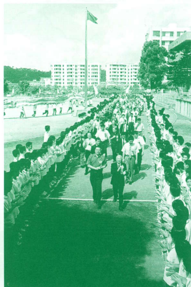
▲ 夾道歡迎（遠處學生舞龍迎賓）。

儀式後基社代表團於校內參觀，校內頗寬敞，設施日趨完善，學習環境頗佳，據云本年度廣州培英也由鶴洞校區，擴展多一個太和校區，祝願培英體系日漸擴大，教育事業譜上新篇。