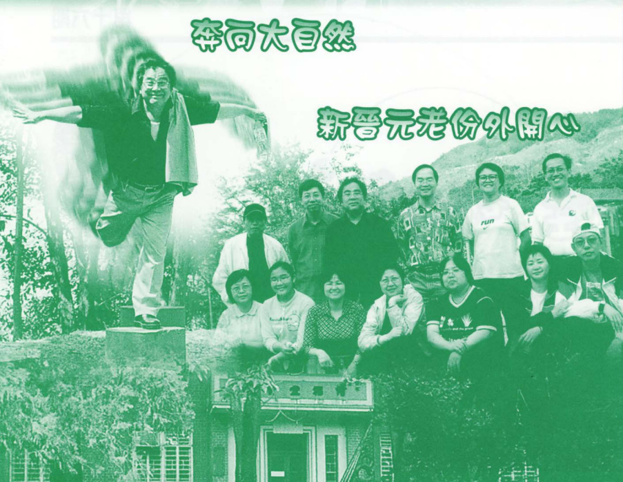
新晉元老份外開心