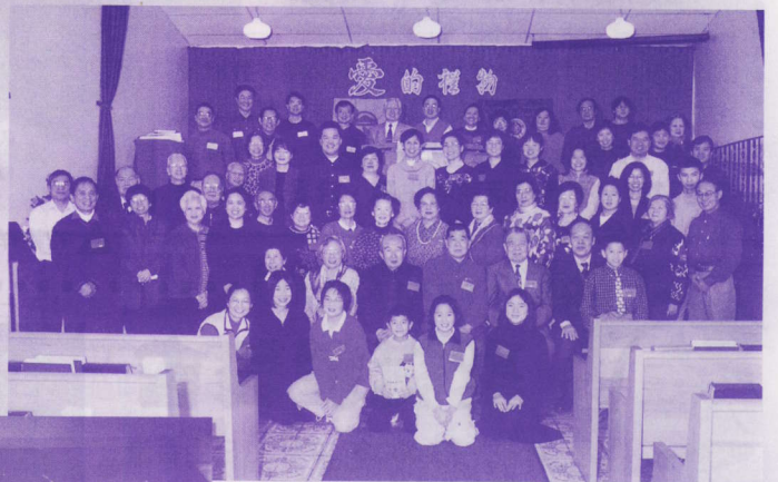
▲ 卡加利培英校友會在 2000 年與培正及嶺南校友會一同慶祝聖誕所攝。