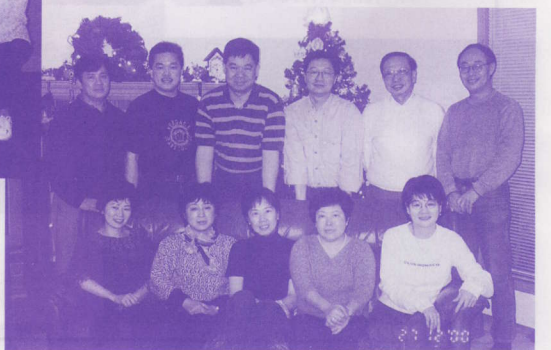
卡加利培英校友會聖誕聚餐合照 ▶