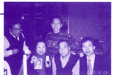
▲ 黃太異常幸運，連續數年皆中獎，今年又得到第七獎(楓葉金幣一枚)。