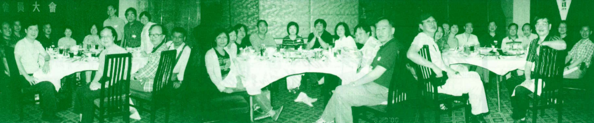
▲ 相裡的人兒看過來。