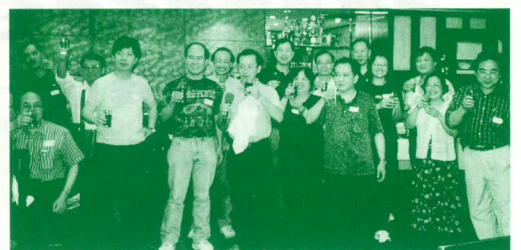
▲ 新一屆職員向各人祝酒。