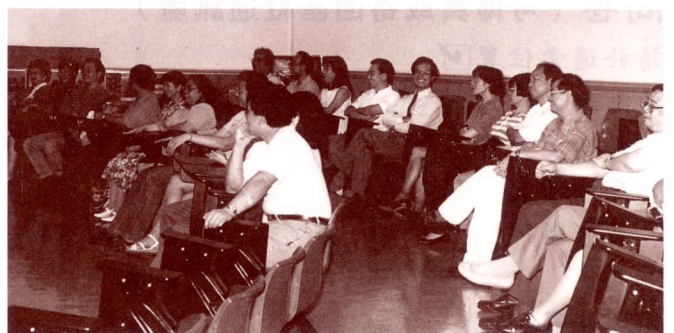
第一次社友大會選舉

位職員共同主理日後聯絡及籌劃活動的工作。大家都希望由出席的廿多位社友開始，到二〇〇一年晉升元老之時，有更多（甚至可以打破歷屆的出席紀錄，因為基社同學總數逾六百人）社友歸寧出席該次盛會。